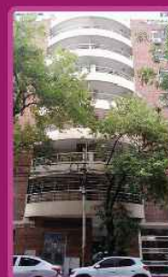
BARTOLOME MITRE 4084 /2009