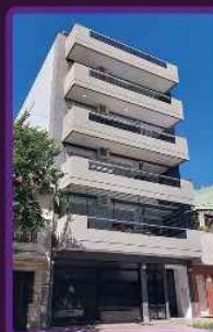
ALFREDO BUFANO 1125 /2018