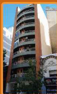
MACHADO 525 /2006