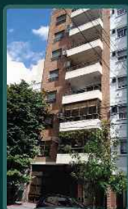
PACHECO 2242 /2004