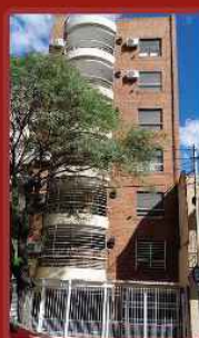
JOSE BONIFACIO 132 /2007