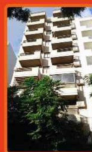
GAVILAN 757 /2014