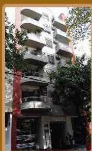
AVALOS 1961 /2011