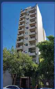
BOYACA 920 /2015