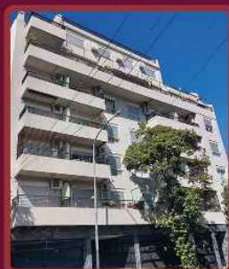
GAVILAN 975 /2016