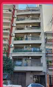
NEUQUEN 1831 /2012